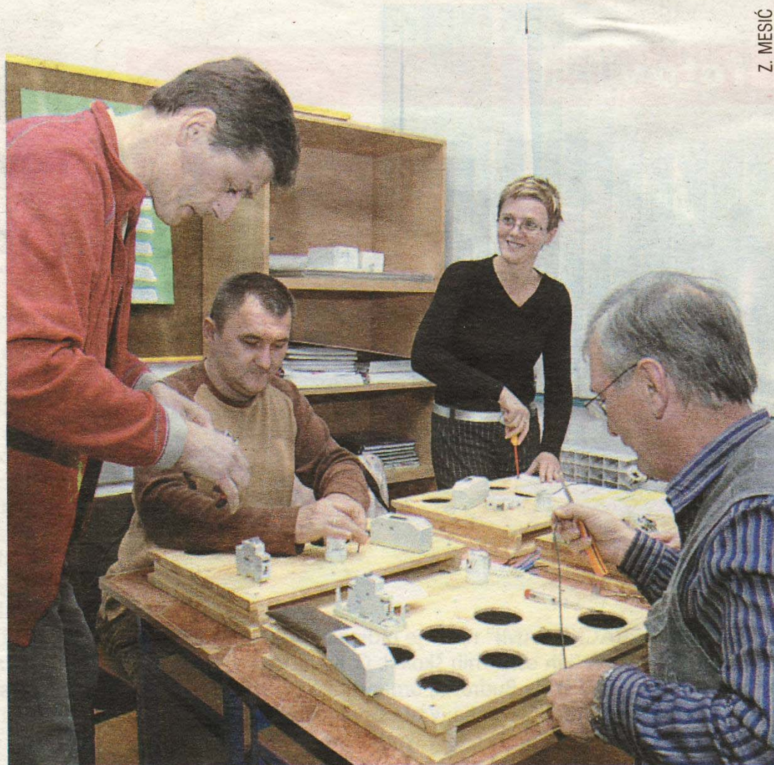
Početak rada bio je u znaku izrade radnih ploča kao pomagala djeci u učenju